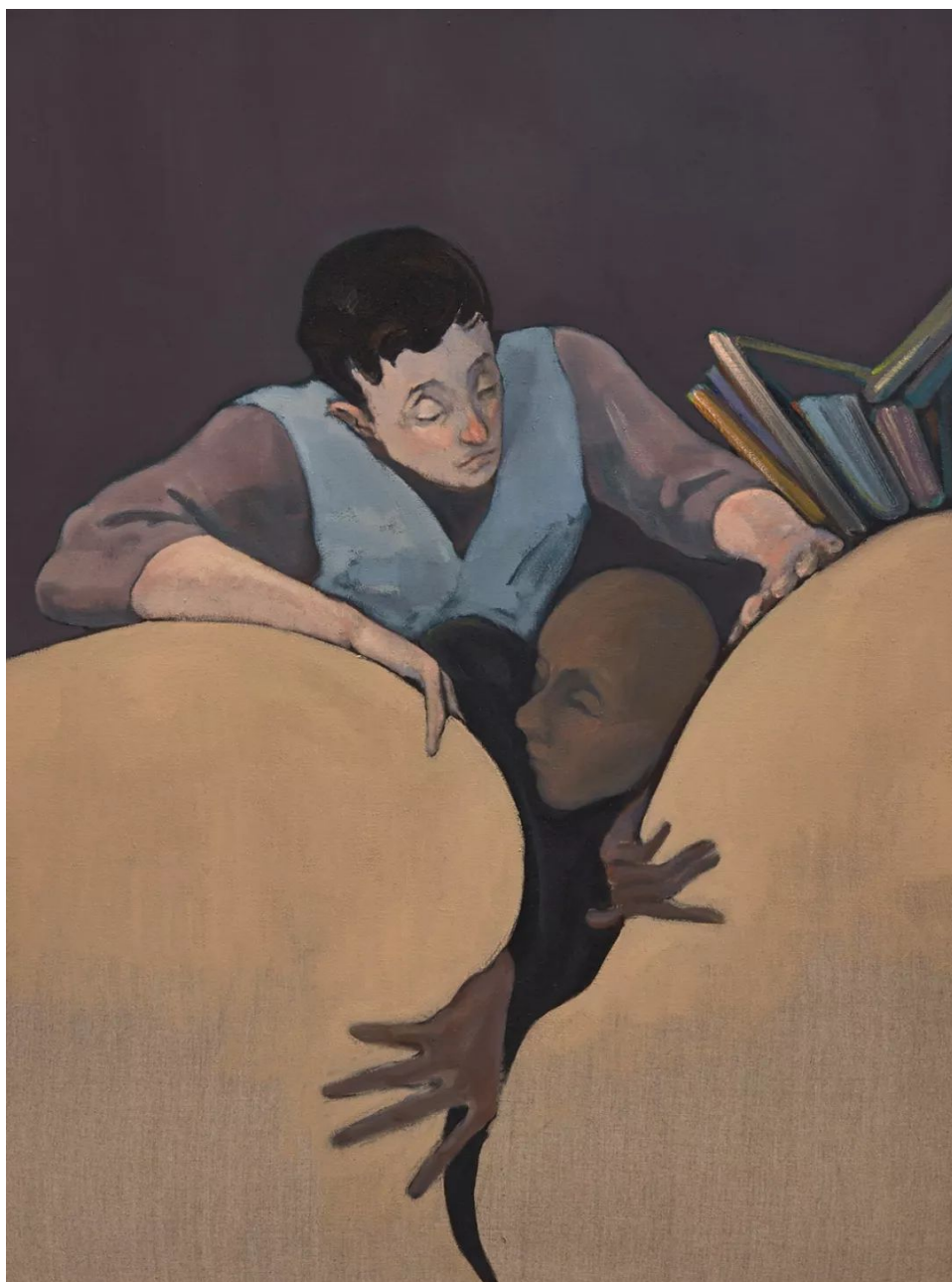
台面上，2019，布面油画，120 x 90 cm

体之间的类雕塑头在搏斗。这个主体被扭曲的形象展现了乔治·巴塔耶、莫里斯·布兰肖和米歇尔·福柯所描述的极限体验：极端的对立在强度和可能性的边缘变得完全相同。