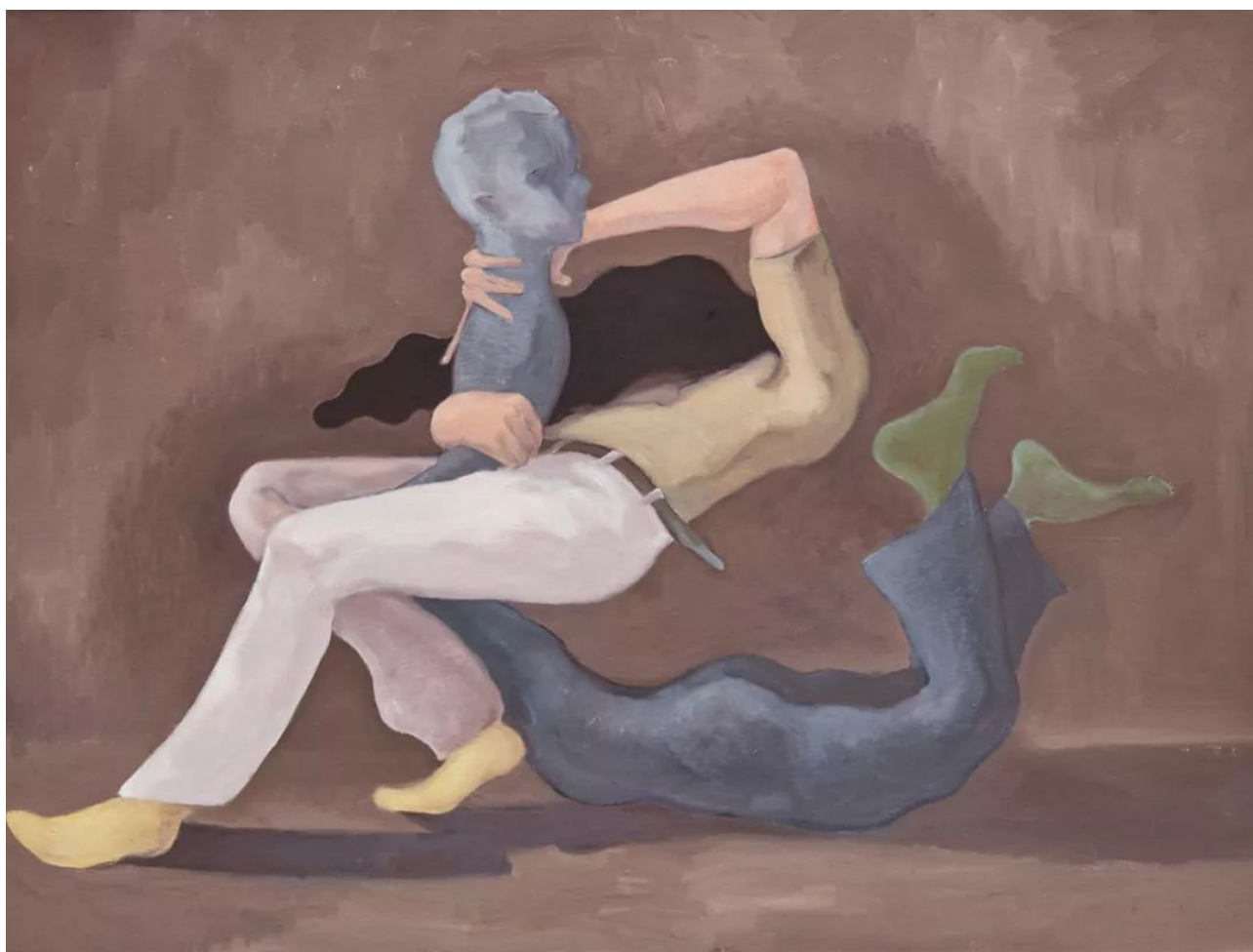
浪人和他的朋友，2019，布面油画，90 x 120 cm

代末60年代初邪恶角色的文献照片被并列放置，用以追踪现代中国剧场和电影里现实主义的各个阶段（或方面）。李然用一种同时期典型电影配音的夸张风格开始讲述瓦·瓦·捷列夫佐夫的故事，他是于20世纪50年代末在上海戏剧学院教授幻觉主义舞台化妆课的一位苏联专家。这些技巧成为表示阶级和意识形态立场，英雄和恶棍对立的有效工具。但在1960年中苏关系破裂导致捷列夫佐夫突然离开中国后，这些来自苏联的技巧就被抛弃了。图像在不断地淡入淡出，揭示着表现形式和政治总是会纠缠在一起，主体地位从基础上来说是不稳定的。