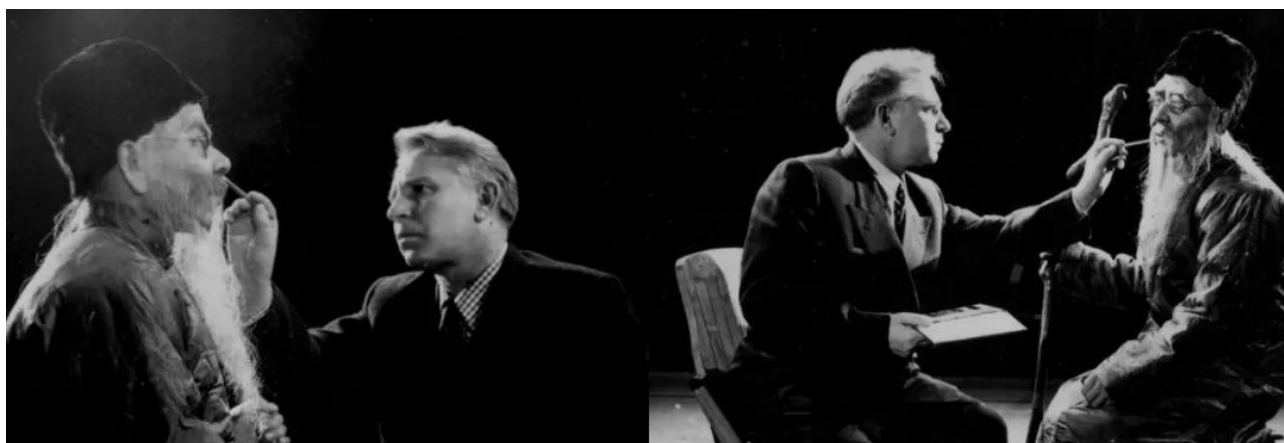
摇身一变，2017 – 2019，同步双频道2K有声影像，黑白&彩色，4.0立体声道，影像截帧，15'30"

李然于2009年从四川美术学院油画系毕业，随后移居北京。在此后的几年里，他主要以影像艺术家的身份发展，这意味着尽管你可能偶尔会看到他的一些画作，但是他的绘画背景还是在很大程度上被忽略了。因此这次在展览《你是谁》看到13幅新的绘画作品让人耳目一新，此次在上海艾可画廊的个展也一同展出了两个影像作品，一幅照片拼贴以及一组雕塑装置。但我们不应将艺术家“回归”某种媒介与他艺术实践中的一次突破混为一谈；正如展览设计中一样明显，李然的绘画特色地布满了对舞台的借鉴并构成了场面调度 ( mise en scène ) 的一部分。幕布将展览分成两个部分：左边是一个升起的明亮舞台，大部分绘画作品都挂在那里，右边是一个灯光昏暗的洞穴式空间。由于入口处没有标志，观众可以随意选择路线。